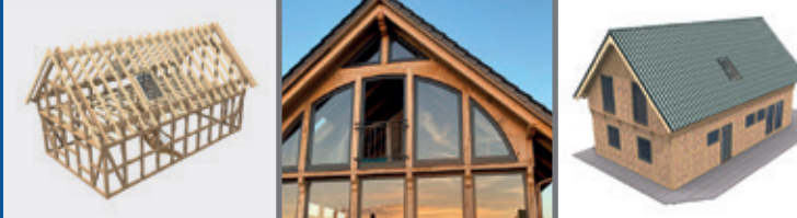
FACHWERKHAUS • BAUSATZ F06