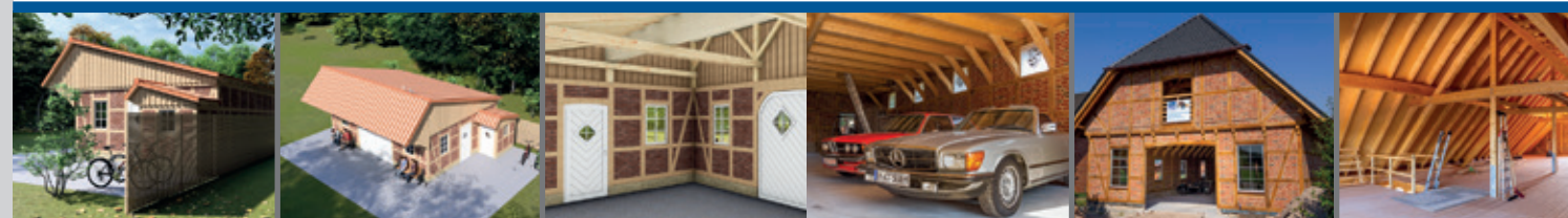
REMISE • BAUSATZ B31