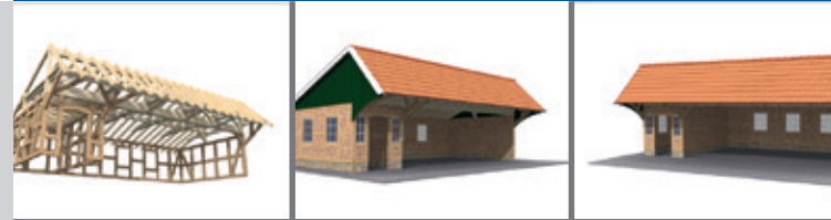
REMISE • BAUSATZ B28